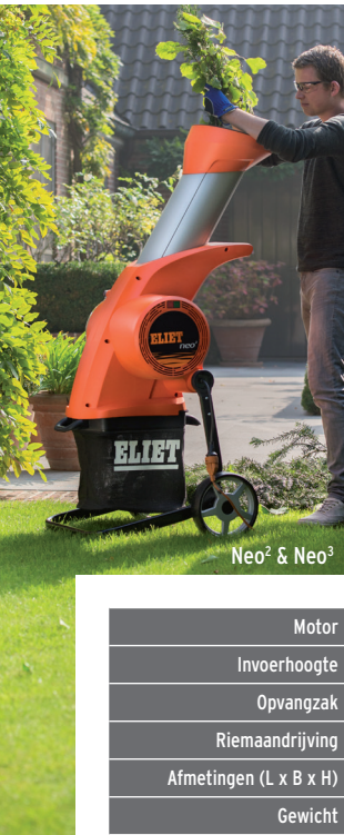
Neo 2 & Neo 3

ELIET versnipperaars zijn uniek. Naast hun gepatenteerde Hakbijlprincipe™ die zorgt voor uniforme, snelcomposterende snippers, combineren deze machines een robuuste bouw met flexibiliteit en compactheid. Met de ELIET versnipperaars kiest u kortom voor bedrijfszekerheid en gegarandeerde resultaten, en dat alles op maat gemaakt voor de professional en de veeleisende particuliere gebruiker.